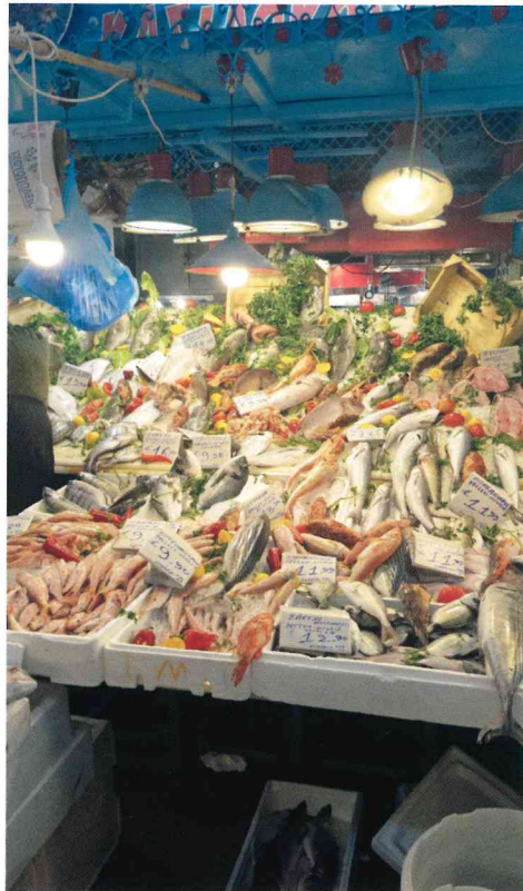
Griekse vismarkt