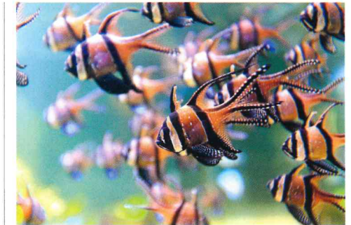
Juweelkardinaalbaarzen in aquarium

Which Fish? daagt daarom de aquariumcurators uit om collectieplannen te maken waarbij de nadruk gelegd wordt op het toevoegen van duurzame soorten aan de collectie.